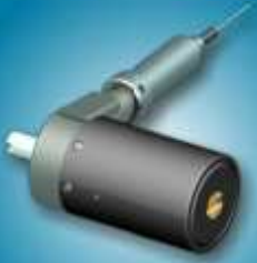
מנעול רכב רב נקודתי לענף הרכב העולמי