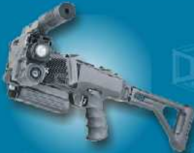
מנגנון סיבוב והחזרה - "קורנר שוט" רובה הפינת