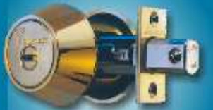
הרקולר- מנעול DEADBOLT ייחודי לשוק האמריקאי