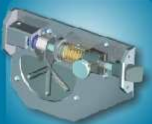
מנעול דלת תא טייס, פרויקט משותף לרב בריח והתעשייה האווירית