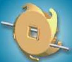
ניג'ה- מותחן חוסי מתכת לחקלאות